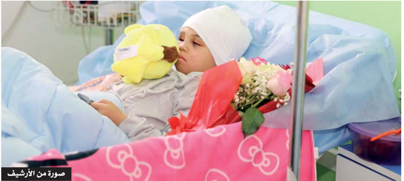
صورة من الأرشيف