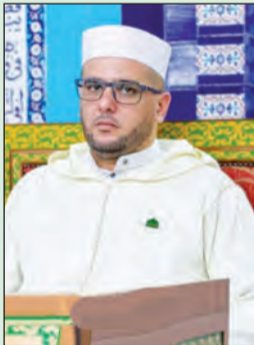
بقلم: الدكتور فضيل صادق إمام مسجد سيدنا لقمان الحكيم بوهران

حادثة الإسراء والمعراج، هي معجزة من معجزات سيدنا رسول الله صلى الله عليه وسلم حباه الله بها، بعد أن فقد سنده الداخلي "السيدة خديجة رضي الله عنها"، التي كانت أول من آمن به ونصره وعزّزه، فترك فقهها حزنا كبيرا