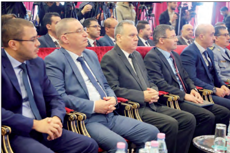
التكنولوجيا وتطوير الكفاءات.