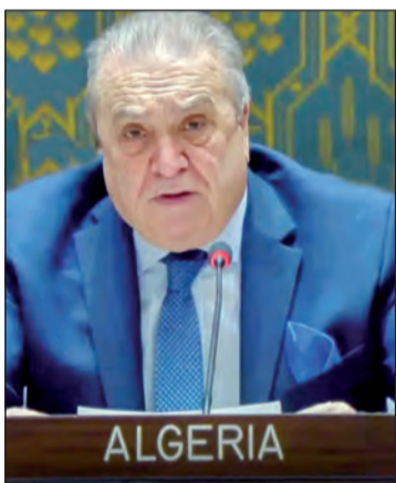
إزالة التلوث البيئي وحماية الصحة العمومية؟ وهل يمكن لعقبات أن تتجاوز المبادئ الأساسية والحقوق الجوهرية للسكان المعنيين؟