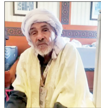
ساعات الصباح في أداء مختلف العبادات، في الوقت الذي يحرص فيه أفراد البعثة الجزائرية للحج على متابعة حالته الصحية

عن كذب وتوفير كل ما يحتاجه من خدمات داخل غرفته بالفندق، حيث يحظى، منذ قدومه إلى البقاع المقدسة، بعناية خاصة، من خلال السهر على راحته وسلامته طوال اليوم. ويؤكد هذا الحاج الجزائري بأن التقدم في العمر ليس عائقا أمام تحقيق الأمنيات العظيمة على غرار الحج، حيث يبقى الشوق إلى زيارة بيت الله الحرام نابضا في القلوب مهما امتدت سنوات العمر. ويتأثر كبير، أعرب هذا الحاج عن سعاده الفاعمة بتحقيق هذه الأمنية، ويقول: "الحمد لله الذي بلغني هذا اليوم. كنت أنتظر هذه اللحظة طوال عمري وأدعوه أن يوفقني لأن أتم الأركان الخمسة للإسلام قبل أن ألقى وجهه الكريم، وما أنا اليوم في بيت الله الحرام. أسأل الله أن يتقبل مني ومن جميع الحجاج الميامين".