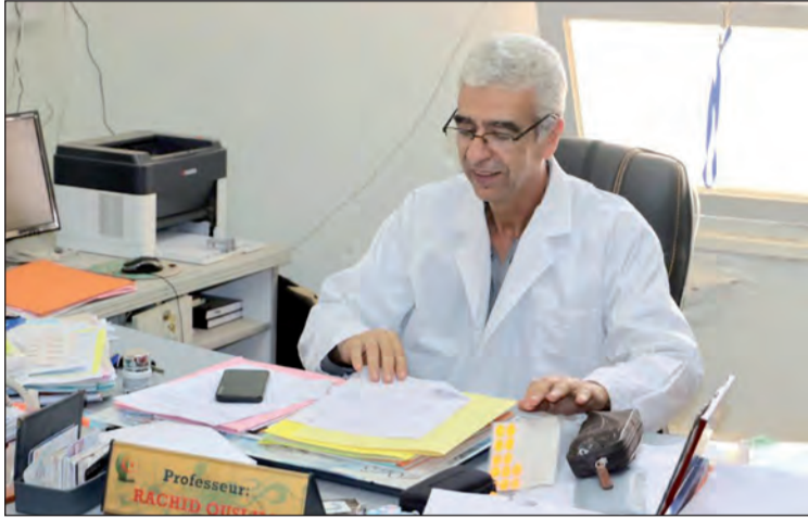
خبيرة غانو

الأعواج الجانبية للعمود الفقري المعروف بداء سكوليوز، وهي الجراحة التي ظلت لسنوات حكرا على عيادات القطاع الخاص، مشيرا إلى أن هذا النوع من الجراحات سيضاف بعد فترة وجيزة إلى قائمة التخصصات المهمة التي ستوفر عليها مصحة جراحة الأطفال بمستشفى بوهران وبمعداتها وإمكاناتها الخاصة، مضيفا أنها في انتظار تجسيد هذا المشروع كانت قد شرعت منذ فترة، وبفضل جراحيها الأكفاء، في إجراء تدخلات على عينة من مرضى سكوليوز عن طريق اكتراء أجهزة ووسائل عمل تستعمل في هذه الجراحة.